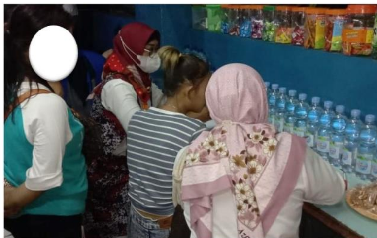
Gambar 3. Kegiatan VCT ( Voluntary Counseling and Testing )