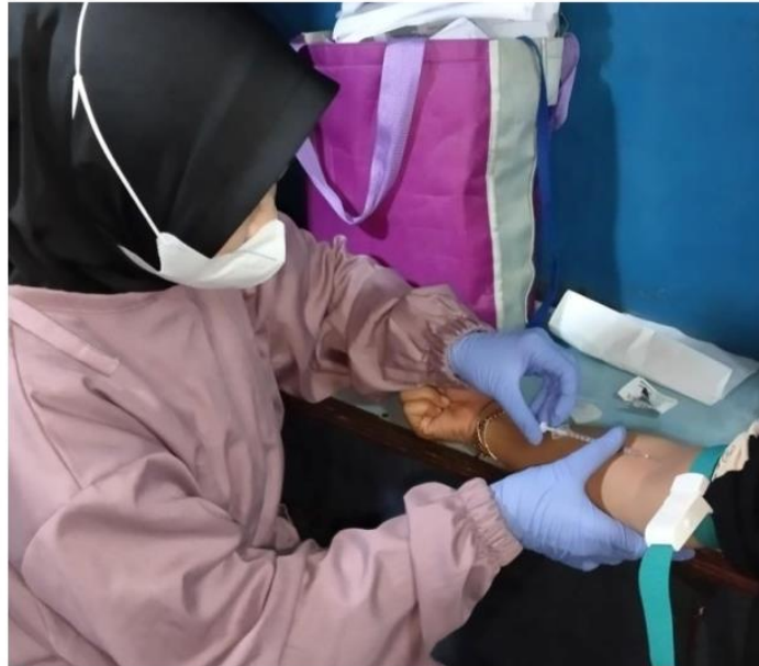
Gambar 4. Tahapan Pengambilan Spesimen