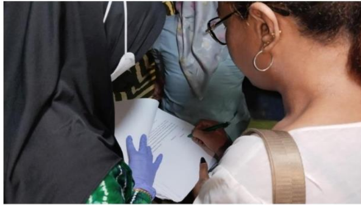
Gambar 1. Penandatanganan Informed Consent