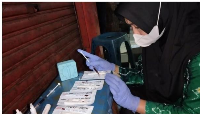
Gambar 5. Pemeriksaan HBsAg