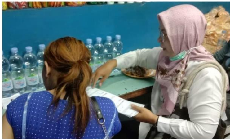
Gambar 2. Pengisian Kuesioner