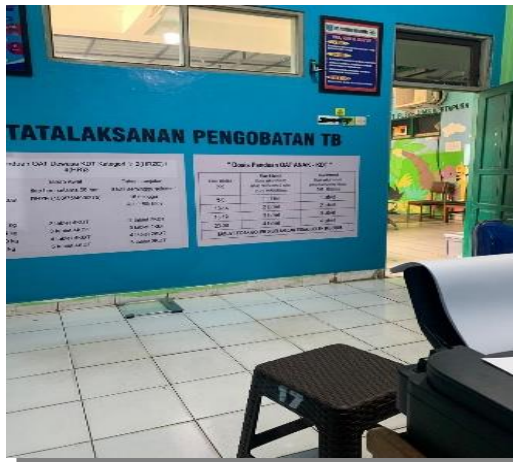
Gambar 1. Poli TB Paru