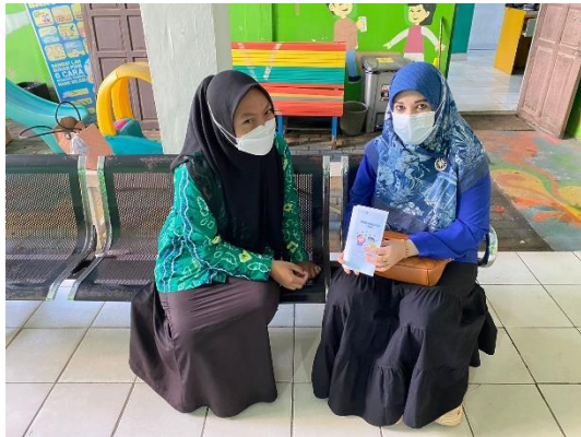
Gambar 8. Edukasi Responden Hari 4