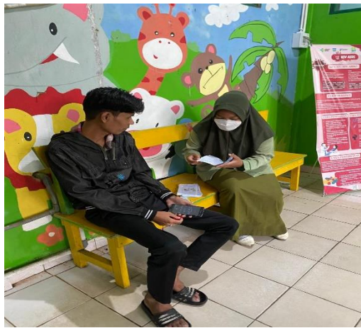
Gambar 5. Edukasi Responden Hari 1