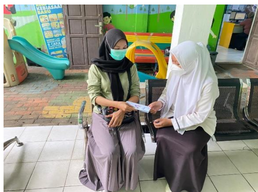
Gambar 6. Edukasi Responden Hari 2