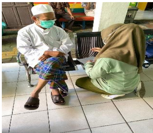
Gambar 3. Menjelaskan Kuisisioner