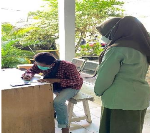
Gambar 4. Pengisian Kuisisioner