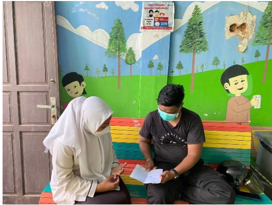
Gambar 7. Edukasi Responden Hari 3