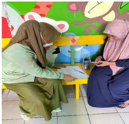
Gambar 2. Informed Consent