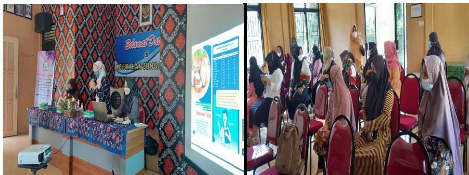
Gambar 2. Sosialisasi kandungan Gizi dan Keamanan Pangan

Pada hari pertama kegiatan pengabdian kepada masyarakat dilaksanakan sosialisasi tentang kandungan gizi pada tanaman talas dan keamanan pangan. Materi diberikan menggunakan slide power point dan leaflet yang berisi tentang kandungan-kandungan gizi yang ada pada talas oleh narasumber dari praktisi rumah sakit idaman. Selain penyampaian materi juga memberikan penambahan wawasan tentang produk-produk olahan yang dapat diolah dari tanaman talas.