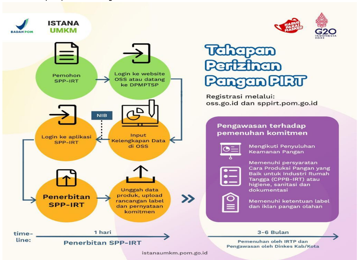
Gambar 4 Tahapan Perizinan Pangan PIRT