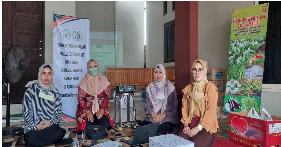
Gambar 2. Pengenalan Nutrisi Daun Kelor oleh Ahli gizi Puskesmas

keamanan pangan. Materi diberikan menggunakan slide power point dan leaflet yang berisi tentang kandungan-kandungan gizi tanaman kelor/daun kelor oleh narasumber dari ahli gizi Puskesmas Landasan Ulin Timur. Selain penyampaian materi, narasumber juga memberikan penambahan wawasan tentang variasi produk-produk olahan dari tanaman kelor/ daun kelor.