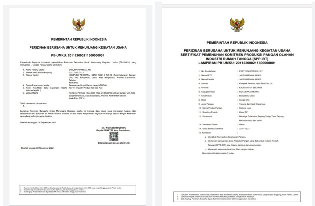
Gambar 5. SPP-IRT yang diterbitkan lewat OSS RB

Proses kegiatan pengabdian masyarakat pemanfaatan sumber daya pangan lokal melalui diversifikasi daun kelor Sebagai alternatif pangan sehat di rumah sakit yang dilaksanakan di Kelurahan Guntung Manggis Kecamatan Landasan Ulin Kota Banjarbaru ini bertujuan untuk memberdayakan kelompok binaan agar dapat mengembangkan potensi diri baik secara individu maupun secara kelompok sebagai wirausaha produk olahan daun kelor. Kegiatan ini diharapkan menambah pengetahuan dan keterampilan sehingga dapat menjadi tambahan penghasilan serta meningkatkan pendapatan keluarga kelompok binaan juga meningkatkan daya tahan tubuh dalam rangka mempercepat penyembuhan penyakit, pencegahan penyakit dan meningkatkan imun tubuh. di masa pandemi Covid-19.